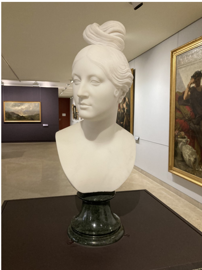
Lorenzo Bartolini, Buste de Mme de Montaran , vers 1838 Musée des Beaux-Arts de Caen